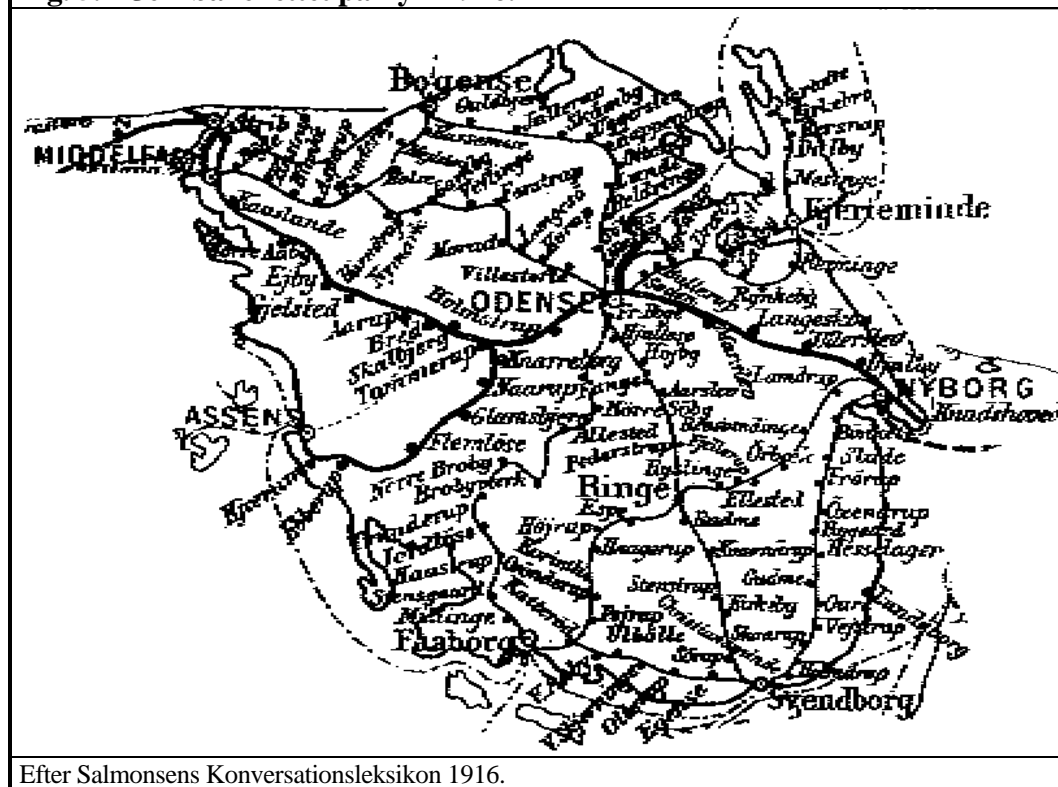
Fig. 5.2 Jernbanenettet på Fyn 1916.