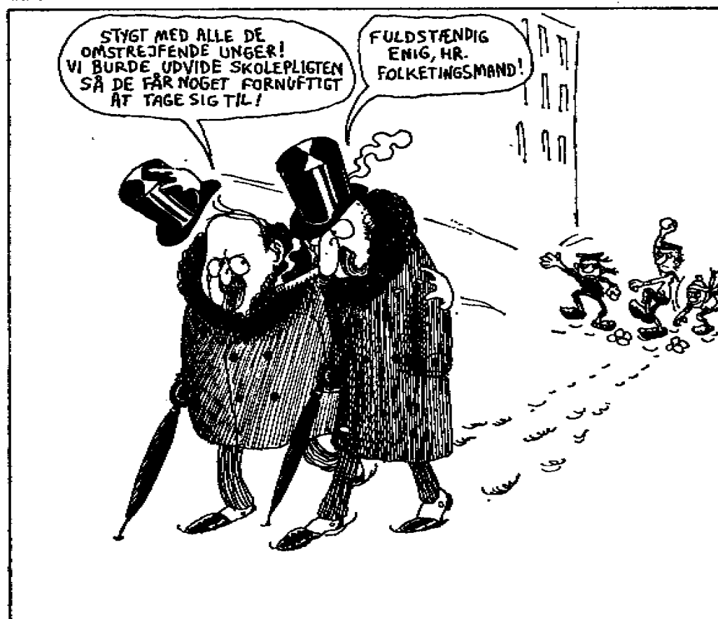
Fig. 5.4 Børneproblemet Med venlig tilladelse fra Claus Deleuran og Lone Deleuran