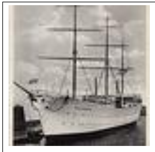
(Herberget: Barkskip Hein Goodenwind Indviet som Hitlerjugend herberg 1934)