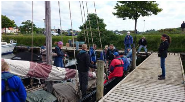
Start fra Augustenborg

9.30 i Augustenborg. Besætning og ting er samlet.