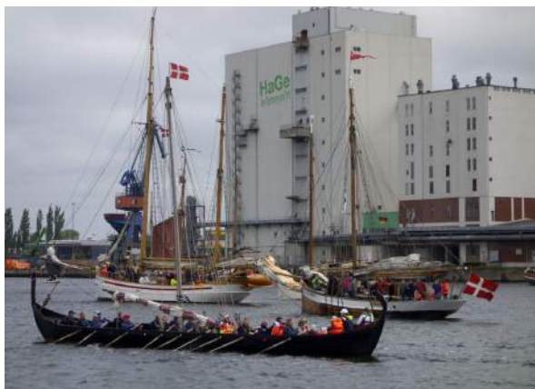
På vej ud af havnen