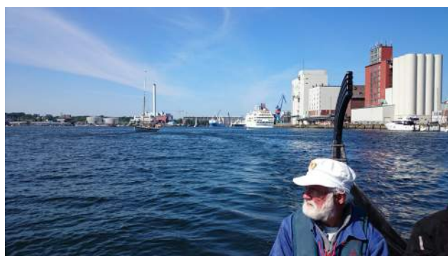
Sejler Flensborg ind

Lidt desorganiseret overnatning: aftale var klar nok, men noget var kokset for Regatta-ledelsen. Men: vi ender med at få stueetagen i Herrenstall.