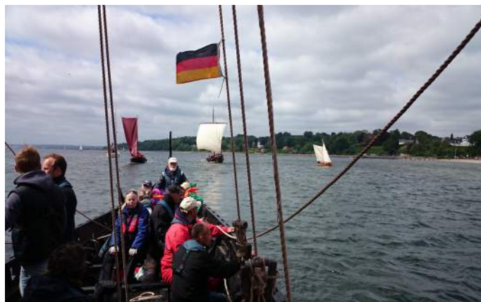
Romregatta set agterud