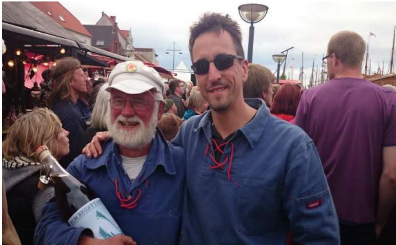
Reder, skipper og 2. præmie