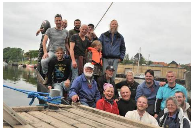
The whole holding company hjemme

Gennem Chr.X bro kl. 13, ankomst Augustenborg kl. 15, pakning og hjemad i bil kl. 16.