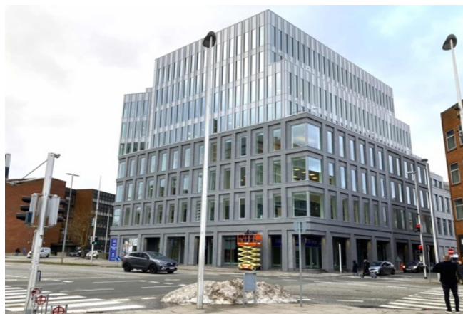
Og bagefter – byens grimme kontorhus

Eftersom de sidste 5 måneder af året både var præget af valgkamp – og derfor af betydeligt mentalt fravær hos en del byrådsmedlemmer og af deres ulyst til at høre på min og Solveigs påpegning af økonomiske og byplanmæssige og socialretlige misligheder – ja, så var min sidste tid i byrådet en kold tid. En enkelt kom dog med en varmende bemærkning, om at Solveig og Viggo var byrådets salt – som turde sige det, andre kun tænkte. Men - meget arbejde. Så meget, at Maj af og til synes, at jeg har været mere gift med Solveig og Byrådet end med hende! Arbejdsbyrden letter nu.