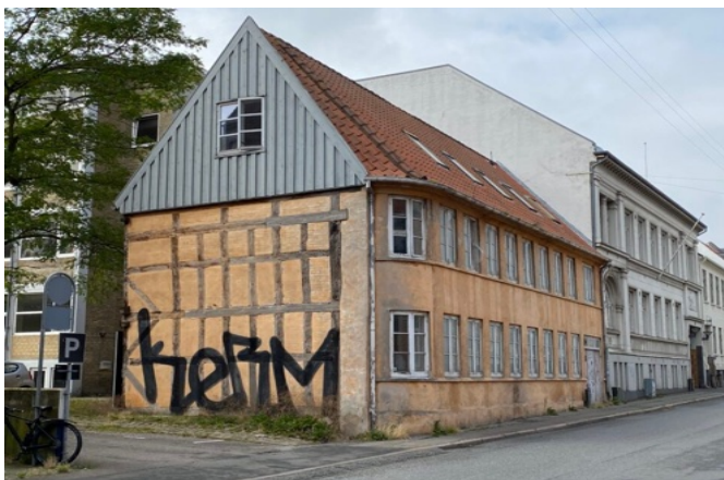
Mindegade 12 – et vel istandsat 1600 tals hus